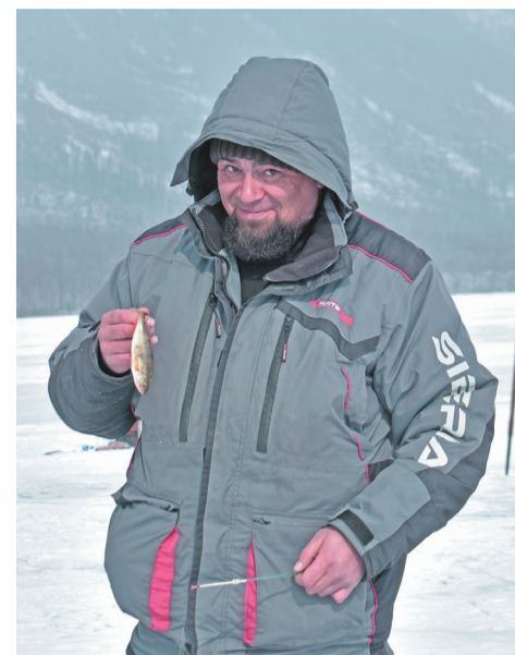
В Рыбалке «Северный Байкал - 2025» участвовали победители прошлых лет: